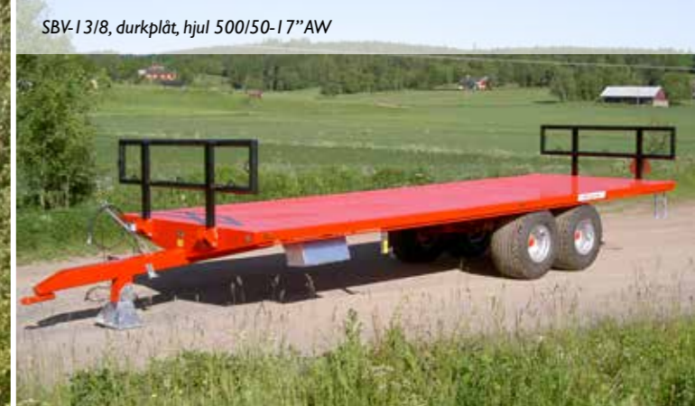
SBV-13/8, durkplåt, hjul 500/50-17"AW