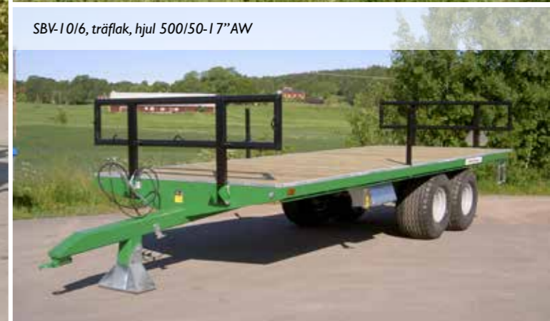
SBV-10/6, träflak, hjul 500/50-17"AW