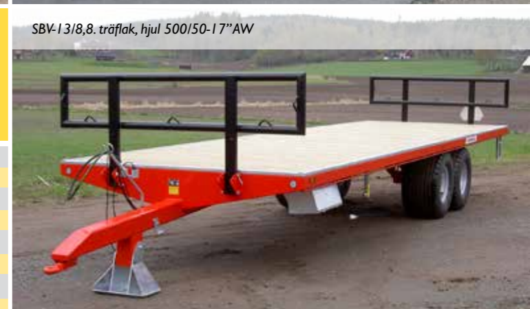
SBV-13/8,8, träflak, hjul 500/50-17"AW