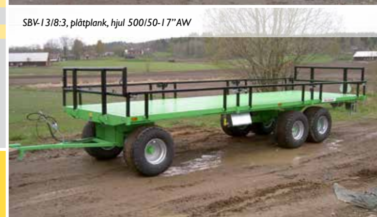
SBV-13/8:3, plåtplank, hjul 500/50-17"AW