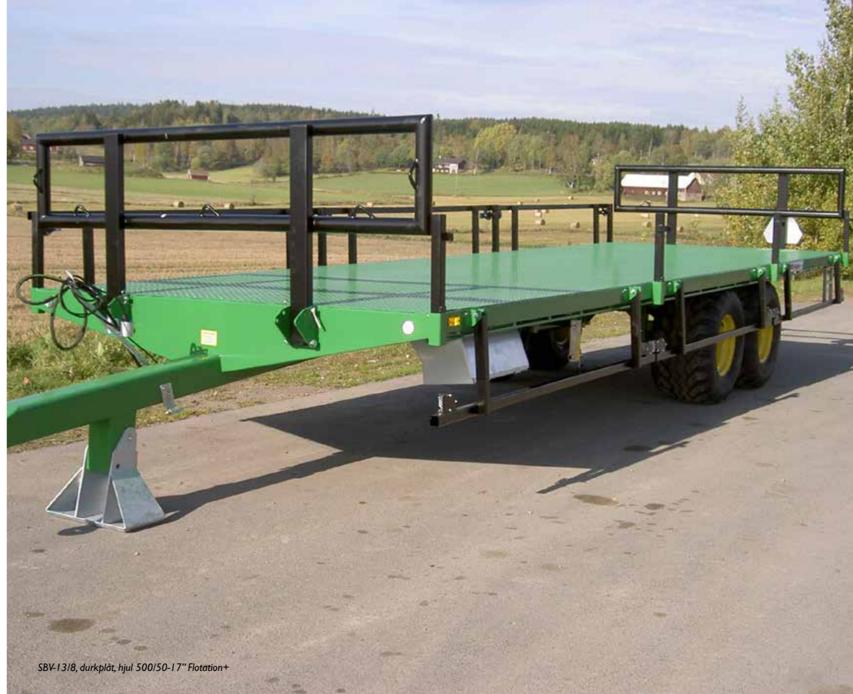
SBV-13/8, durkplåt, hjul 500/50-17" Flotation+