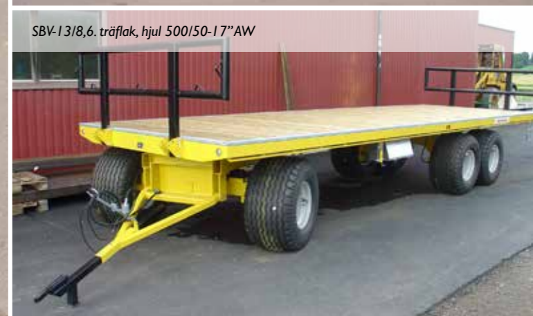
SBV-13/8,6, träflak, hjul 500/50-17"AW